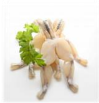
Cuisses de Genouilles