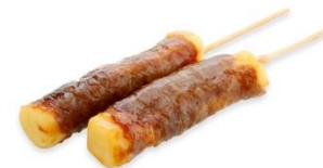
Brochettes Boeuf Fromage