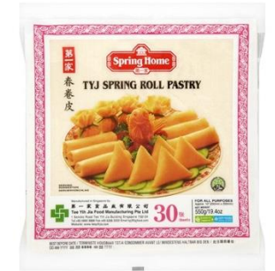
Feuilles de Brick