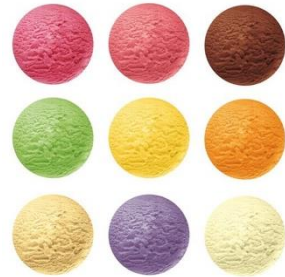
Glaces et Sorbets (10 parfums)