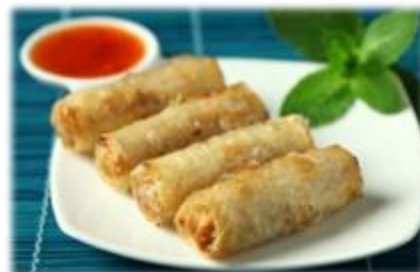
Nems au Poulet