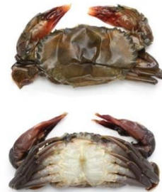
Crabe Mou Soft Shell Crab