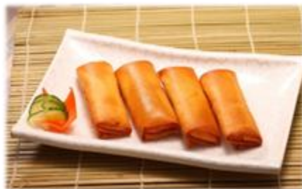
Rouleaux au Poulet, Légumes