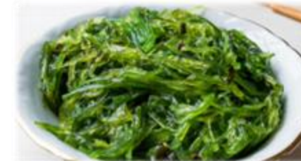
Wakame Salade d'Algue