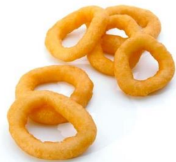
Beignets de Calamar