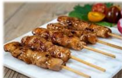
Brochettes de Poulet Yakitori