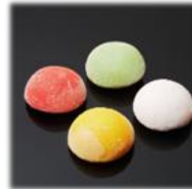
Mochi Glacé (8 parfums)