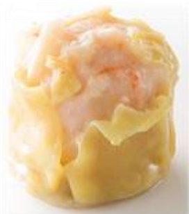
Bouchées de Crevettes