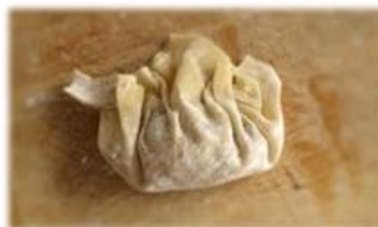
Wonton aux Crevettes