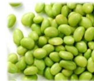
Edamame Fèves Pelées