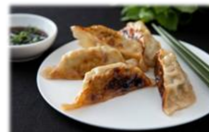
Gyozas Poulet, Crevettes, Légumes